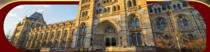
พิพิธภัณฑ์ประวัติศาสตร์โลกทางธรรมชาติ