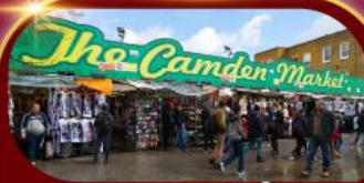
ตลาดแคมเดน