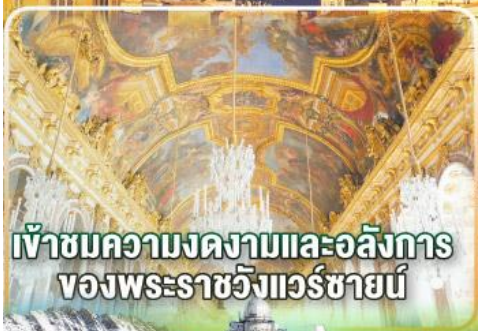
เข้าชมความงดงามและอลังการ ของพระราชวังแวก์ซายน์