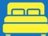
ห้องพักดับเบิล DOUBLE