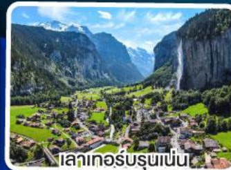
เลาเทอร์บรุนเนน