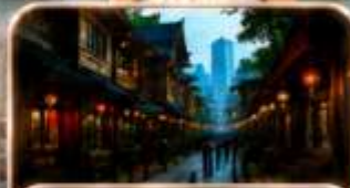
หมู่บ้านโบราณฉือซีโซ่ว