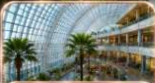
THE RING MALL CHONGQING