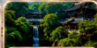
ถนนโบราณ เจียฟางเป่ย์