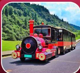
"อุทยานเขานางฟ้า"