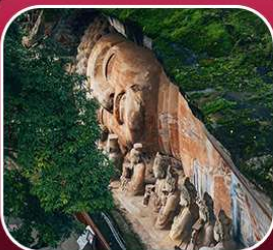
"ผาหินแกะสลักต้าจู้"