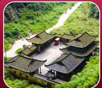
"อุทยานหลุมฟ้า"

T2G-CKG34(3U) The Best Chongqing...ฉงชิ่ง ต้าจู้ อุ่หลง เขานางฟ้า 5D 4N (3U)