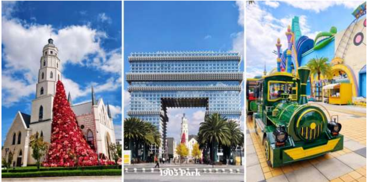
วัดหยวนทง – PARK1903 – สนามบินคุนหมิงฉางชู่ – กรุงเทพฯสุวรรณภูมิ (อิสระอาหารกลางวัน)

จากนั้นนำท่านสู่ Park 1903 (สวน 1903) แลนด์มาร์คสุดชิค ได้กลิ่นอายยุโรปและศูนย์การค้าไลฟ์สไตล์ใจกลางเมืองคุณหมิง (มณฑลยูนนาน) ที่โดดเด่นด้วยการจำลองสถาปัตยกรรมสไตล์ยุโรป ผสมผสานศิลปะ ความบันเทิง และสวนสนุกเข้าไว้ด้วยกันอย่างลงตัว สถาปัตยกรรมจำลอง ประตูชัยปารีส อันโด่งดังโบสถ์คริสต์ (Gospel Auditorium) และพื้นที่จัดแสดงนิทรรศการPop Mart สาขาใหญ่ สำหรับสายอาร์ตทอยสวนสนุก Dream Park: สวนสนุกที่มีทั้งโซนในร่มและกลางแจ้ง (ทัวร์ไม่รวมค่าเข้าสวนสนุก)เป็นแหล่งเสื้อผ้าแบรนด์เนมทั้งของจีนและต่างประเทศ เครื่องประดับอัญมณีชิ้นเยี่ยม ร้านเครื่องดื่ม ร้านอาหารพื้นเมือง