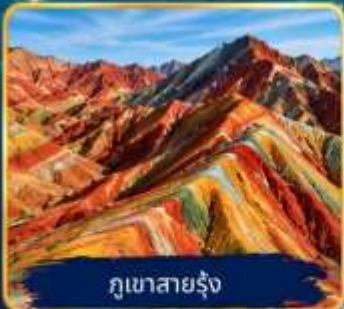
ภูเขาสายรุ้ง