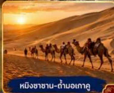
หมิงซาซาน-ถ้ำมอเกา