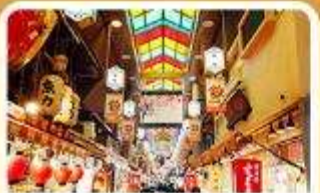
ตลาดปลาเนชิกิ