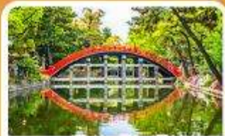
ศาลเจ้าสุมิโยชิ โกเบ