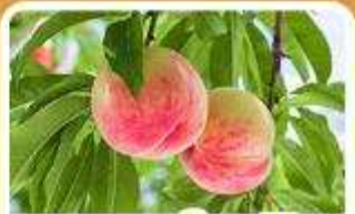
กิจกรรมเก็บผลไม้