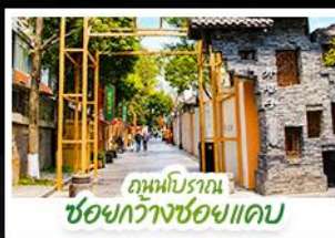
ถนนโบราณ ซอชวงชอยแคบ