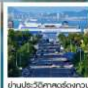
ย่านประวัติศาสตร์

Fisherman's Wharf • จิดูริสซิงไห่ (รวมรถราง) • ถนนดงท้วน • เวนิสแห่งต้าเหลียน • ถนนรัสเซีย ย่านประวัติศาสตร์ และวัฒนธรรมดงท้วน • มังกรทางเมืองต้าเหลียน • กำแพงเมืองจินด่านจวิหยงท้วน • ซานหลี่ตุบ • ถนนคนเดินไท่กู่หลี่