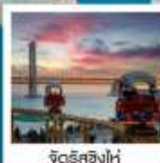
จิดูริสซิงไห่