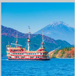
“ASHI CRUISE 30 MINS”