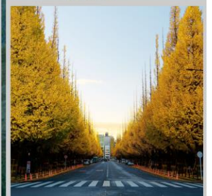
"ICHONAMIKI GINGO AVENUE"