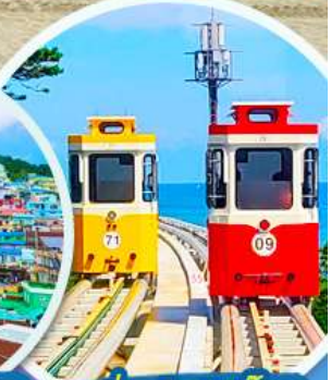
นั่งรถไฟปู๊กบีก

ราคานี้รวมค่าภาษีสนามบิน + ค่าภาษีสนามบิน ** ปรับขึ้น ณ วันที่ 1 เม.ย. 69 เรียบร้อยแล้ว **