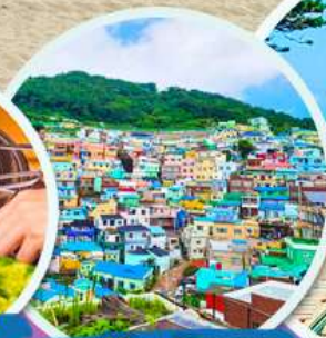
หมู่บ้านคัมซอน