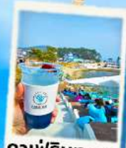
คาเฟ่ริมทะเล