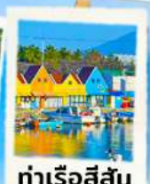
ท่าเรือสีสัน