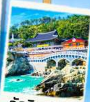
วัดริมทะเล