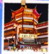
ตลาด 100 ปี