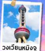
วงเวียนหมิงจู