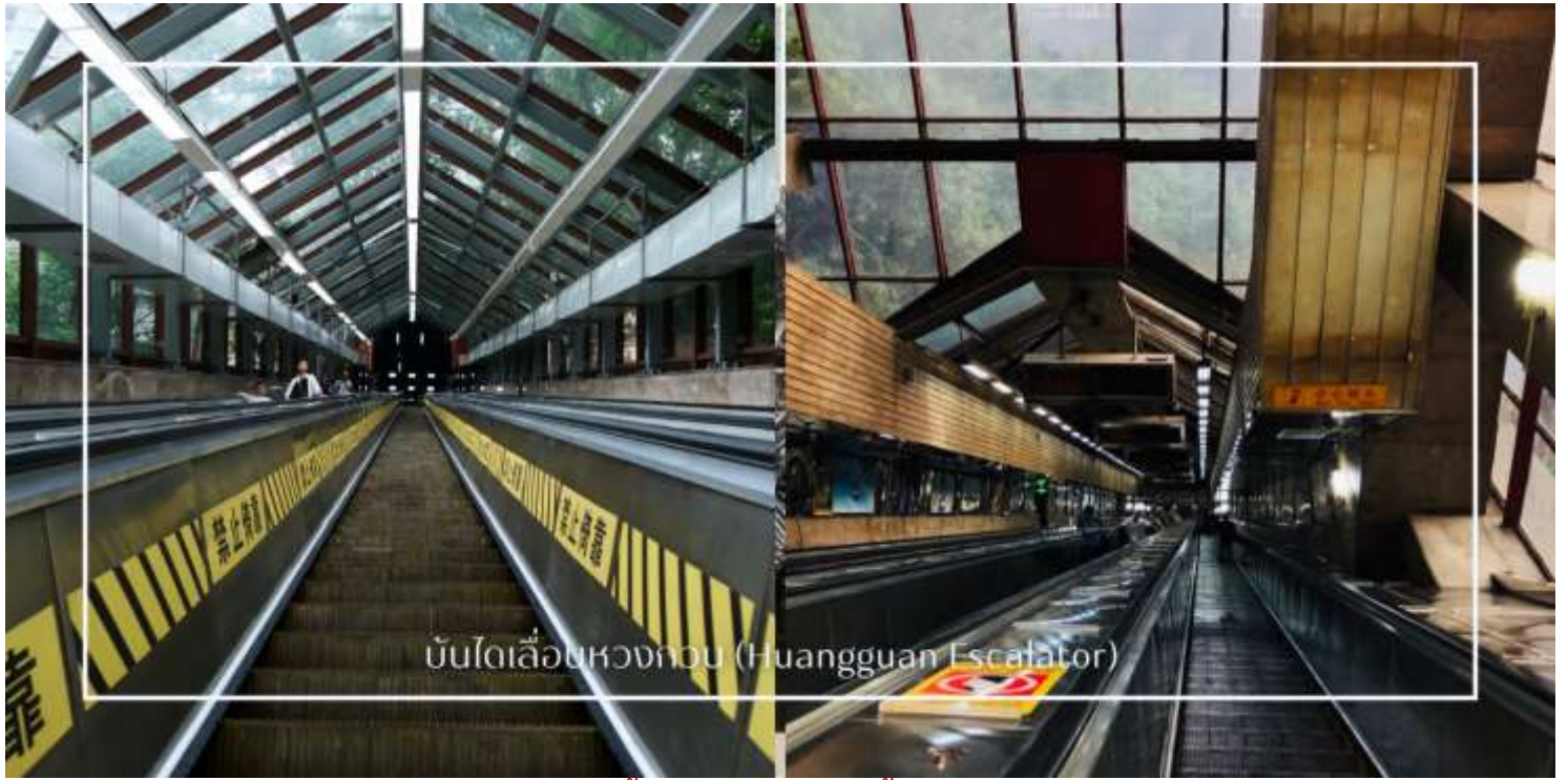
บันไดเลื่อนหวงกวน (Huangguan Escalator)

เที่ยง บริการอาหารเที่ยง ณ ภัตตาคาร (มื้อที่8) เมนูพิเศษ : สุกี้หม่าล่า