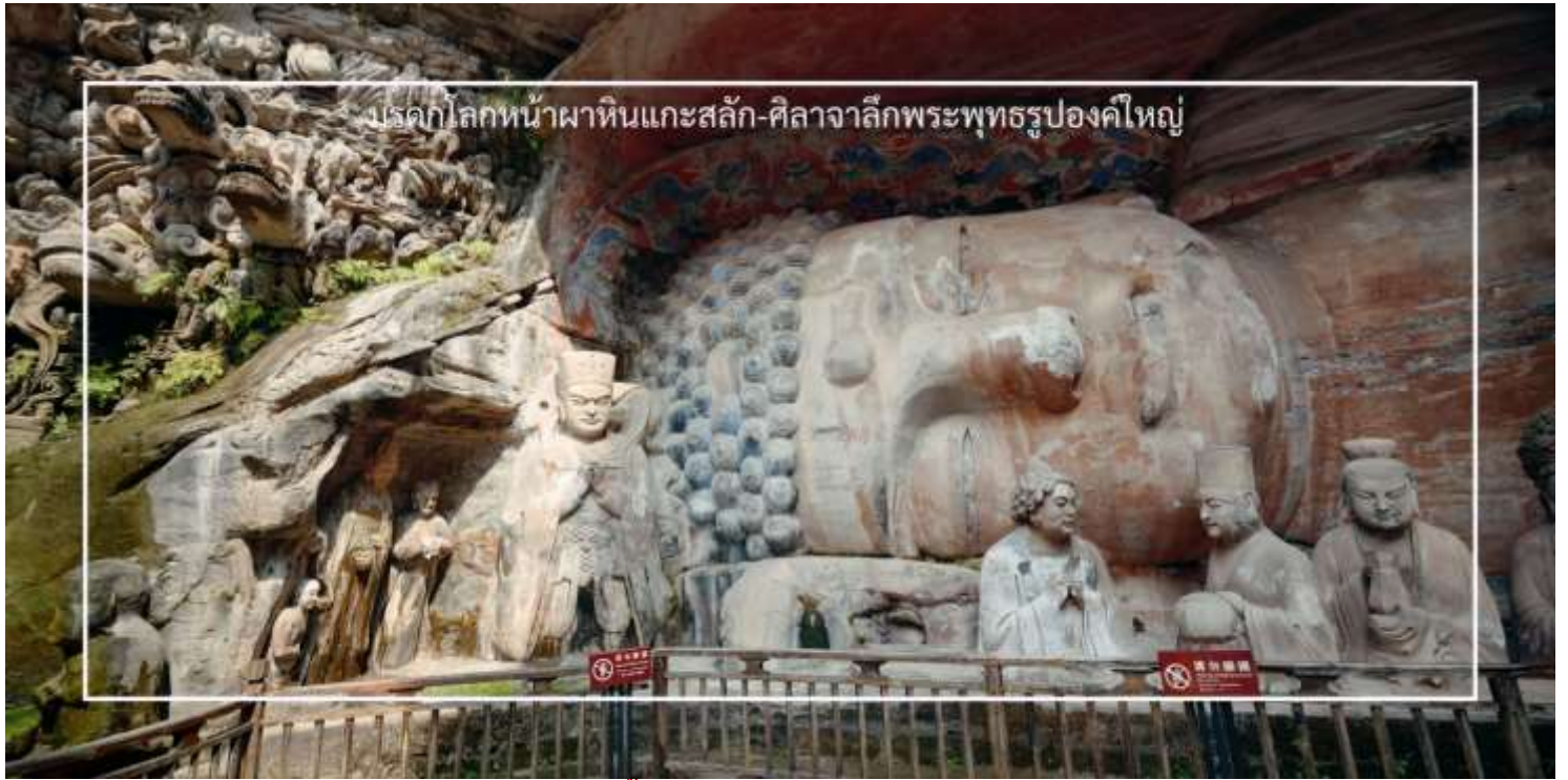
บรรดากลมหินหน้าผาหินแกะสลัก-ศิลาจากลึงพระพุทธรูปองค์ใหญ่