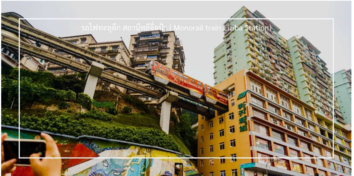
รถไฟฟ้าลูตึก สถานีหลี่จื่อเป่า (Monorail train Liziba Station)

ถ่ายภาพโมเมนต์สุดล้ำนี้จากมุมต่างๆ ของเมือง จุดชมวิวนี้ไม่เพียงสร้างความตื่นตาตื่นใจ แต่ยังเป็นสัญลักษณ์ของการผสมผสานระหว่างเมืองสมัยใหม่กับภูมิประเทศที่มีภูเขาและแม่น้ำรายล้อม