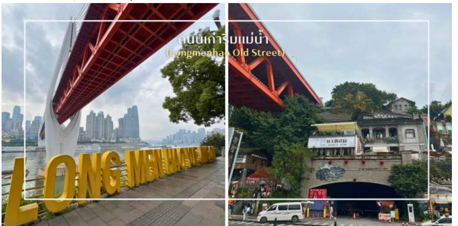
ถนนเก่าริมแม่น้ำ (Longmenhao Old Street)

นำท่านสู่ ถนนโบราณหลงเหมินฮ่าว (Longmenhao Old Street) ถนนเก่าริมแม่น้ำอีกหนึ่งแลนด์มาร์กสำคัญของเมืองฉงชิ่ง ถนนสายนี้เคยเป็นย่านการค้าและศูนย์กลางเศรษฐกิจที่รุ่งเรืองในยุคราชวงศ์หมิงและชิง ปัจจุบันได้รับการอนุรักษ์ไว้อย่างดี เพื่อเป็นแหล่งเรียนรู้ทางประวัติศาสตร์ และแหล่งท่องเที่ยวเชิงวัฒนธรรมที่เต็มไปด้วยเสน่ห์บรรยากาศของถนนยังคงอบอวลไปด้วยกลิ่นอายวันวาน อาคารบ้านเรือนแบบโบราณผสมผสานกับร้านค้า ร้านอาหาร และแกลเลอรีร่วมสมัยอย่างลงตัว อีกทั้งยังเป็นจุดชมวิวแม่น้ำที่โดดเด่น สามารถมองเห็นสะพานข้ามแม่น้ำแยงซีและทัศนียภาพของเมืองฉงชิ่งในมุมที่สวยงาม และอีกหนึ่งจุดหมายที่สะท้อนเสน่ห์ดั้งเดิมของที่นี่คือ Xiahaoli Old Street ตรอกซอกซอยแคบ ๆ บันไดหิน และสถาปัตยกรรมไม้โบราณที่ยังคงกลิ่นอายของวิถีชีวิตในอดีต แม้ในปัจจุบันจะได้รับการบูรณะและพัฒนาให้เหมาะกับการท่องเที่ยว ก็ยังคงรักษาบรรยากาศคลาสสิกเอาไว้ได้อย่างดี