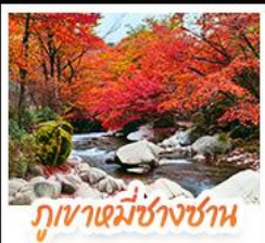
ภูเขาหมี่ชางชาน