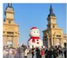
ตึกตาทิมะฮักซ์

โบสถ์ซันไฮเซี่ย / คฤหาสน์วอลการ์ / โบสถ์ซันตปีโกลัส / Harbin Polar Park หมู่บ้านหิมะ: SNOW TOWN + กิจกรรมสาดน้ำร้อนกลางแจ้ง / เซาเปียงดูช DREAM HOME (รวมค่าเช่า) / สนเสงตีกกลางคืนถนนเซ่มนูเจีย + สวนพาเหรดดิสนีย์ ภาพยนตร์ ICE AND SNOW (ฟรี! Snow Tubing ท่าอากาศยาน: 1 รอบ) ถนนจงหยาง (ฟรี! ไอศกรีมหน้าตึยเอ๋อเอ๋อ) / เกาะพระอาทิตย์ (รวมรถแบดเจอร์) Harbin 2027 International Ice and Snow Festival / หลอโอบ่าฮาร์บิน อุป๋นตึกตาทิมะฮักซ์ + ระเบียงฉนวนตึย / ทะพานกระจกรกไฟประวัติศาสตร์