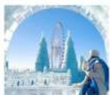
ICE & SNOW FEST.