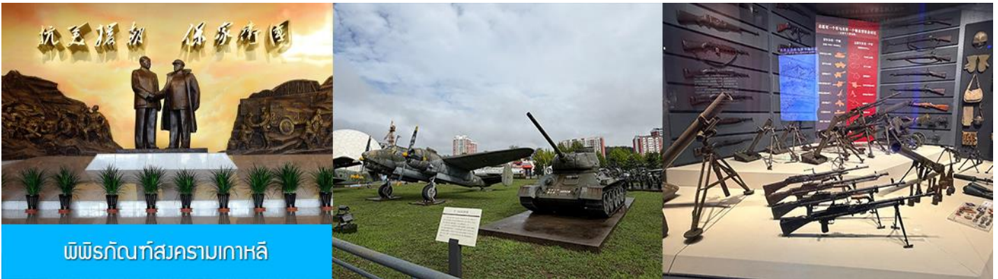
พิพิธภัณฑ์สงครามเกาหลี