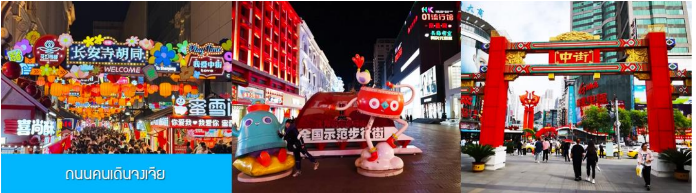
ถนนคนเดินจางเจีย