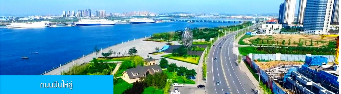
ถนนปินไห่ลู่

ล้อมด้วยตึกระฟ้าที่ทันสมัย ภายในมีบ่อน้ำพุดนตรี ลานหญ้าขนาดใหญ่ และลานกว้างสำหรับจัดกิจกรรม กลางแจ้ง อาทิ เทศกาลเบียร์นานาชาติ การแข่งขันวิ่งมาราธอน งานแฟชั่นนานาชาติเมืองต้าเหลียน ฯลฯ