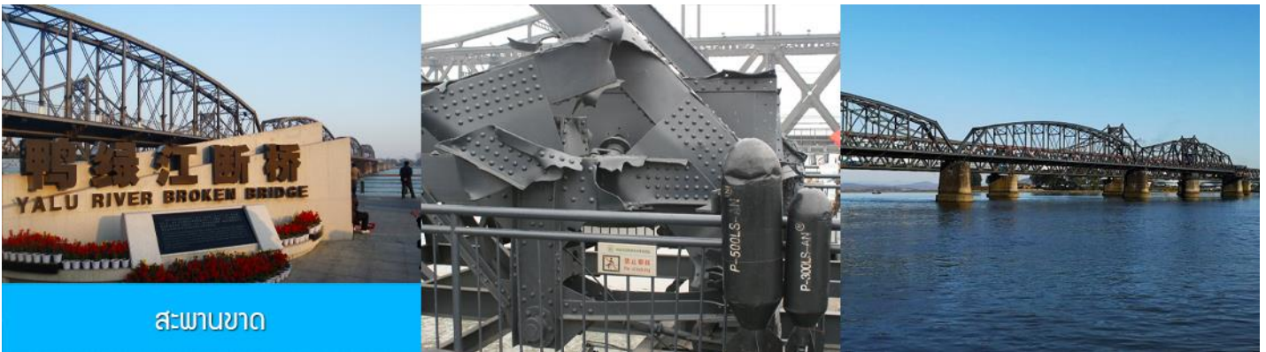
สะพานขาด