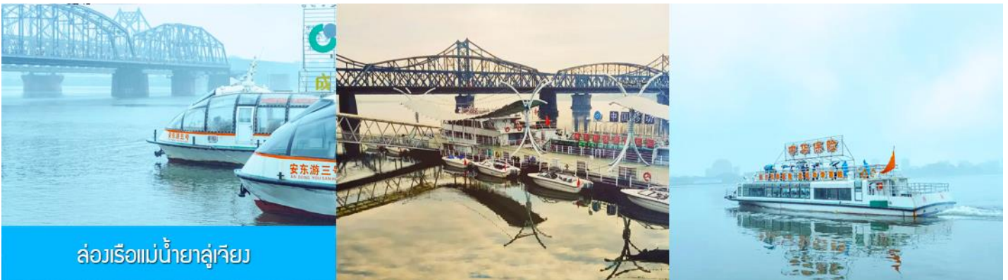
ล่องเรือแม่น้ำยาลู่เจียง

หลังอาหารให้ท่านพักผ่อนตามอัธยาศัยในโรงแรม