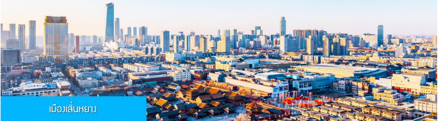
เมืองเสิ่นหยาง