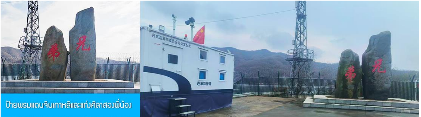
ป้ายพรมแดนจีนเกาหลีและแท่งศิลาสองพี่น้อง