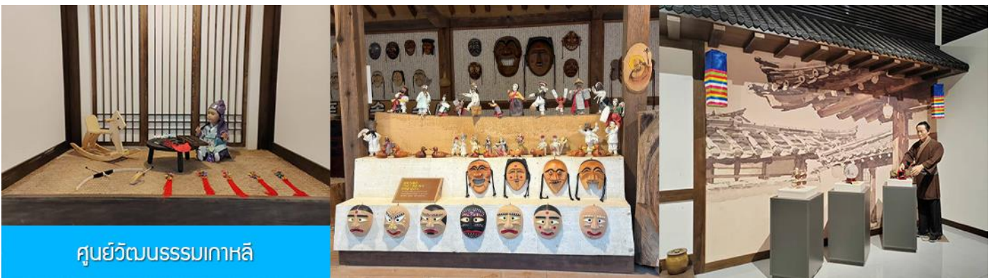
ศูนย์วัฒนธรรมเกาหลี

เช้า รับประทานอาหารเช้า ณ ห้องอาหารของโรงแรม (9)