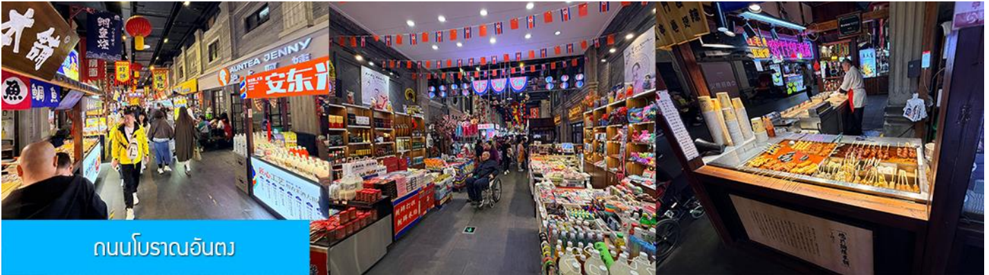
ถนนโบราณอันตง

จากนั้นนำท่านเที่ยวชม ถนนโบราณอันตง 安东老街 ถนนโบราณนี้เริ่มมีชื่อเสียงในฐานะเป็นย่านการค้าที่คึกคักที่สุดในใจกลางเมืองอันตง (ภายหลังได้เปลี่ยนชื่อเป็นต้นตง) ในปีค.ศ. 1876 ในสมัยราชวงศ์ชิง ปัจจุบันถนนสายนี้ยังคงไว้ซึ่งอาคารบ้านเรือนยุคเก่า(ราชวงศ์ชิง) และอบอวลด้วยวัฒนธรรมพื้นเมือง โบราณ ท่านจะได้สัมผัสการละเล่นและการแสดงพื้นเมือง ร้านค้าจำหน่ายของที่ระลึก ร้านอาหารท้องถิ่น และสตรีทฟู้ด ฯลฯ