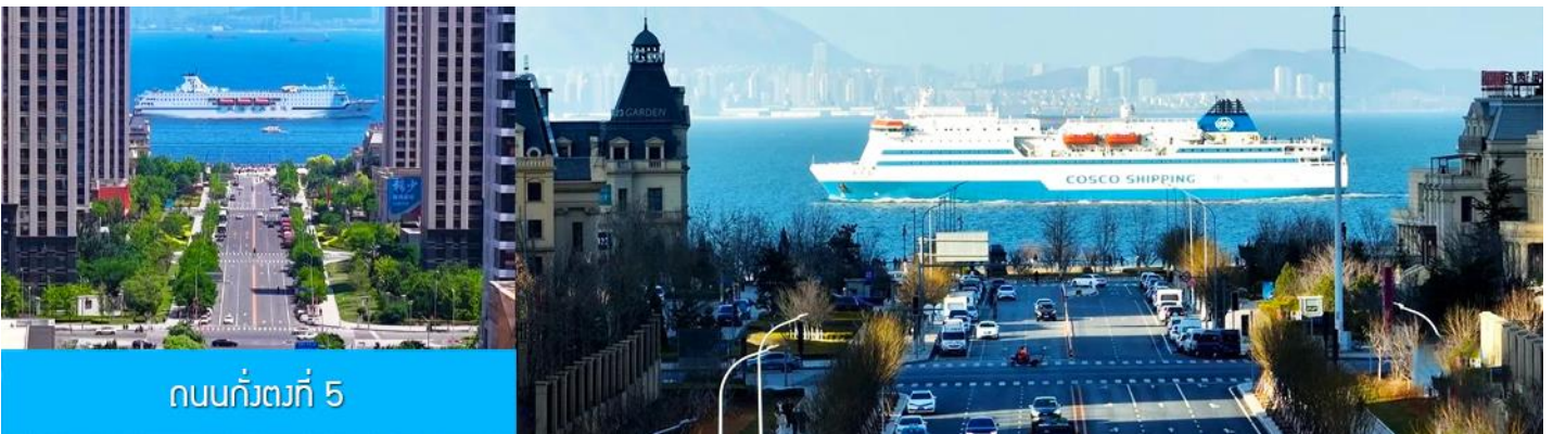
ถนนกั๋วตงที่ 5