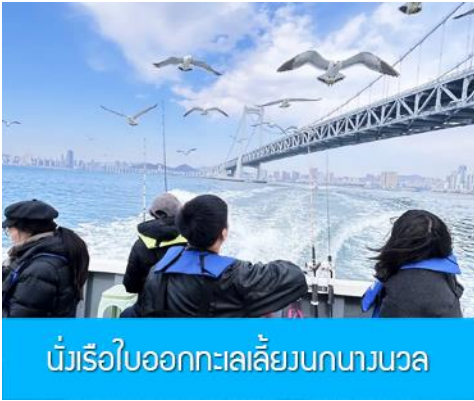
นั่งเรือใบออกทะเลลิ้นกนางนวล

ต่อด้วยนำท่านเที่ยวชม ถนนรัสเซีย 俄罗斯风情街 ในอดีตที่นี่เป็นศูนย์ที่ตั้งของที่ทำการเมืองต้าเหลียน ภายหลังได้กลายเป็นชุมชนของพ่อค้าและวิศวกรทางรถไฟชาวรัสเซีย บริเวณนี้จึงเต็มไปด้วยอาคารบ้านเรือนแบบตะวันตก(รัสเซีย) มากมาย นอกจากนี้ได้เก็บภาพที่มีพื้นหลังเป็นอาคารสถาปัตยกรรมตะวันตก ที่นี้ยังมีร้านค้าที่จำหน่ายสินค้าและของที่ระลึกที่น่าเข้าจากรัสเซีย อาทิ ช็อกโกแลต เหล้าวอดก้า ตุ๊กตารัสเซีย ฯลฯ