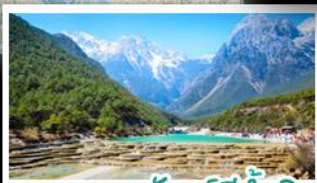
ภูเขาพระจันทร์สีน้ำเงิน