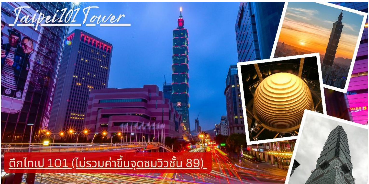
ตึกไทเป 101 (ไม่รวมค่าขึ้นจุดชมวิวชั้น 89)

แห่งนี้ตึกที่มีความสูงถึง 508 เมตร ภายในตัวอาคารมีลูกตุ้มขนาดใหญ่หนักกว่า 660 ตันที่ช่วยถ่วงสมดุลของตัวตึกไว้ และช่วยการสั่นสะเทือนเวลาที่เกิดแผ่นดินไหวและในอดีดยังเคยสูงที่สุดในโลก ตึกไทเป 101 ยังคงความเป็นที่ 1 ไปได้คือลิฟต์ที่เร็วที่สุดในโลก ใช้เวลาขึ้นถึงชั้น 89 เพียงแค่ 37 วินาทีเท่านั้น ** ท่านสามารถเลือกซื้อ Optional บัตรชม ตึกไทเป 101 วิวชั้น 89 ผ่านทางบริษัททัวร์ กรุณาแจ้งความประสงค์ ณ วันจองทัวร์ หรือแจ้งล่วงหน้าก่อนการเดินทางก่อนเดินทางอย่างน้อย 7 วันทำการ**