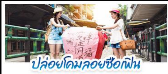
ปลอ้อคอมลอยซือเฟิน