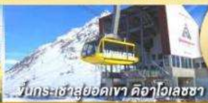
ขึ้นกระเช้าสู่ยอดเขา ดิจาไฮลชซา