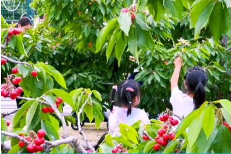
สวนเชอร์รี่

รับประทานอาหารเช้า ณ ห้องอาหารของโรงแรม (10)