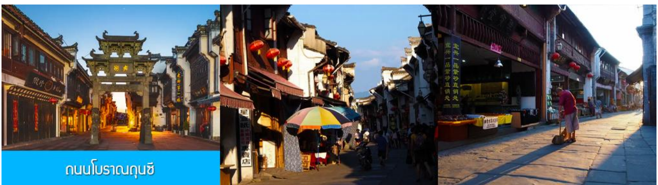
ถนนโบราณฉุนซี

อิสระอาหารมื้อกลางวัน ( ท่านสามารถเลือกชิมอาหารพื้นเมืองในระแวกโรงแรมได้ตามอัชชาศัย )