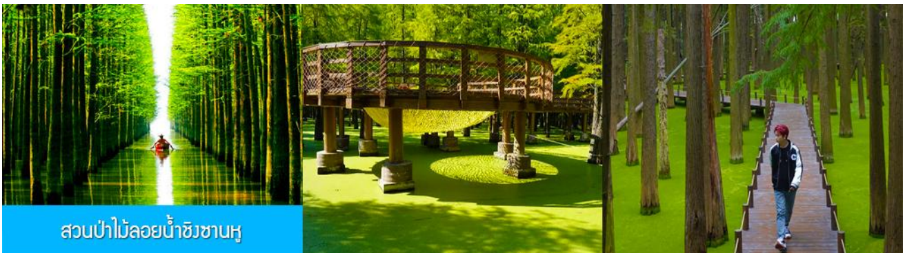
สวนป่าไม้ลอยน้ำชิงซานหู

หลังอาหารเช้าท่านเดินทางโดยรถบัสสู่เมืองหลิงอัน 临安市 (ระยะทาง 175 กม. ใช้เวลาเดินทางราว 2 ชั่วโมงเศษ)