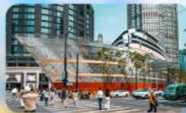
เรือทลยส์วิตคอง