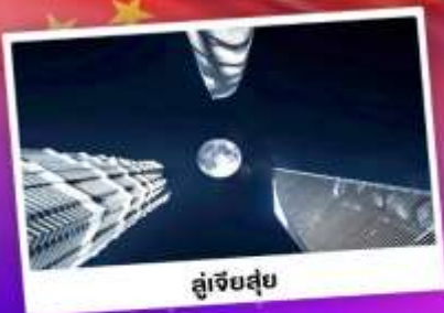
อู่เจียส่วย