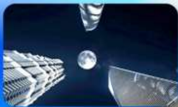
ลู่อิจยส์