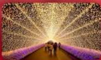
นาบานาโนะซาโตะ