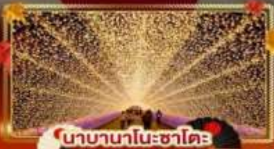
นาบานาโนะซาโตะ

"ชมความงามของฤดูใบไม้เปลี่ยนแล้ว" เที่ยวครบจบทุกไฮไลท์ โอซาก้า-โตเกียว พิเศษ!! บินแอร์แบบ FULL SERVICE