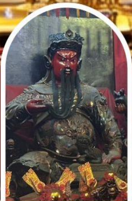
วัดกวนโถ

ขอเทพเจ้ากวนอู ความซื่อสัตย์ เงินทอง ธุรกิจมั่นคง