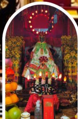
วัดเจ้าแม่กวนอิมฮ่องฮำ

เสริมโชคกลางนำความรุ่งเรืองทุกด้านของชีวิต