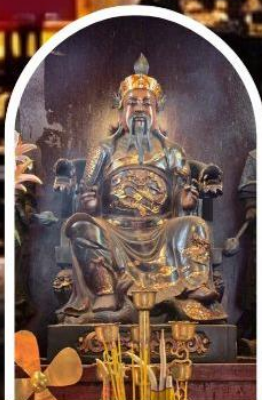
วัดปักโต

ขอเทพเจ้ากวนอู ความซื่อสัตย์ เงินทอง ธุรกิจมั่นคง