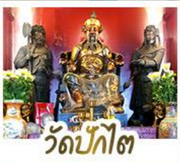
วัดป้กโต