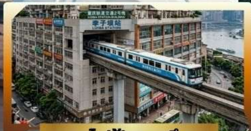
รถไฟฟ้าทะลุติ๊ก