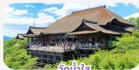
วัดน้ำใส