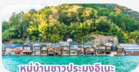
หมู่บ้านชาวประมงอินะ