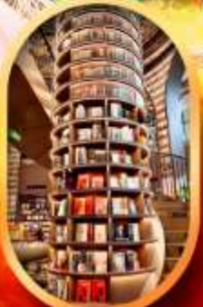
อุทยานปี้เผิงโกว