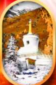
อุทยานสัตว์