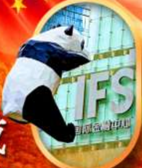
IFS หมีแพนด้าป็นตึก