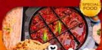
มือพิเศษ สุกี้หม่าล่า