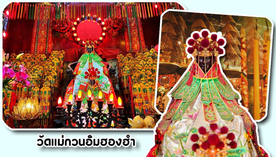
วัดแม่กวนอิมสองห้า

จากนั้นพาท่านเดินทางสู่ เมืองอ่องกง พาท่านไปไหว้ขอพรองค์เจ้าแม่กวนอิม ณ วัดแม่กวนอิมสองห้า วัดเก่าแก่ของอ่องกงสร้างตั้งแต่ปี ค .ศ.1873 เป็นวัดขนาดเล็กที่มีชาวอ่องกงศรัทธา นับถือกันเป็นอย่างมากวัดแห่งนี้เป็นที่ประดิษฐาน องค์เจ้าแม่กวนอิมสองห้า ที่มีชื่อเสียงเรื่องการให้ยืมเงินเชื่อกันว่าท่านช่วยพลิกฟื้นเศรษฐกิจของชาวอ่องกง ผู้คนจึงนิยมมาเยี่ยมเงินทำธุรกิจจนสำเร็จร่ำรวย รุ่งเรืองโดยให้ท่านอธิษฐานขอพรต่อหน้า เจ้าแม่กวนอิมสองห้าพร้อมกับระบุวัน เวลาในการขอพรด้วย จากนั้นนำธนบัตรตามฐานะและศรัทธาที่เราจะนำเป็นสื่อในการขอพร เขียนจำนวนเงินที่ต้องการลงไป ด้วย ใส่สกุลเงินยิ่งดีใหญ่ แล้วนำเงินใส่ในซองแดง ควรเตรียมซองแดงไปเอง นำซองแดงไปวนรอบกระถางรูป วนขวาจำนวน 3 ครั้ง แล้วเก็บซองแดงในกระเป๋าสตางค์เป็นเงินขวัญถุง ถ้าประสบความสำเร็จตามที่มุ่งหวัง ให้นำเงินในซองแดงทำบุญหยอดตู้ที่วัดแห่งนี้ในโอกาสต่อไป