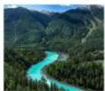
อุทยานคานาสือ