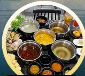
ซาบู้ฮ่องกง

02-04 มี.ย. 18-20 มี.ย. 07-09 มี.ย. 20-22 มี.ย. 13-15 มี.ย. 25-27 มี.ย. 14-16 มี.ย. 28-30 มี.ย.