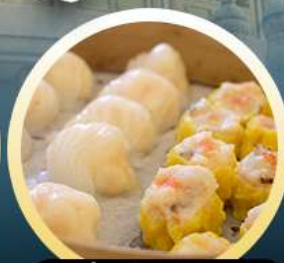
ต้มน้ำฮ่องกง