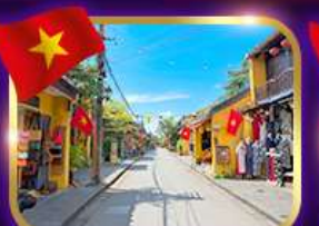
เมืองเก่ามรดกโลก ฮอยอัน