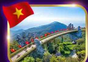
สะพานมือสีทอง บานาฮิลล์

เวียดนาม ดานัง ฮอยอัน พักบานาฮิลล์ 4วัน3คืน เดินทาง 16.ย. - 19.ย. 69