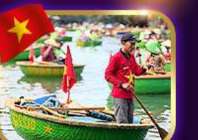
เรือกระด้ง หมู่บ้านกิมกาน