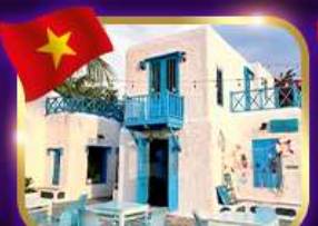
คาเฟ่สุดชิค ชานทรา มาริน่า