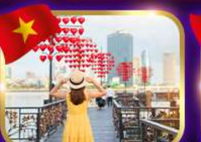
เช็คอินสะพานแห่งความรัก