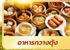
อาหารกวางตุ้ง