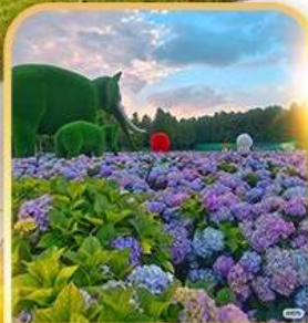
ดอกไม้ตามฤดูกาล