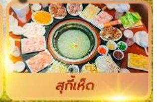
สุกี้เห็ด