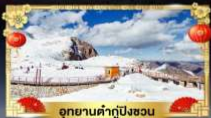
อุทยานคำกู่ปิงชวน