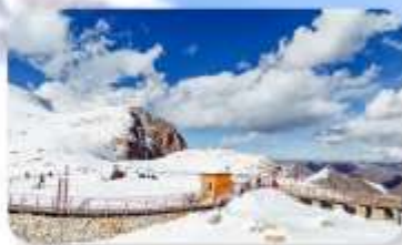
อุทยานคำกู่ปิงชวน