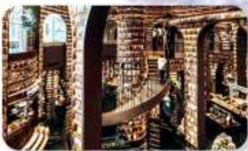
ร้านหนังสือจงซูเก้อ