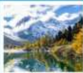
ปี้ผิงโกว