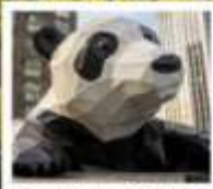
ห้าง IFS แพนด้าปิ่นตึก