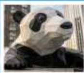
ห้าง IFS แพนด้าปิ่นตึก