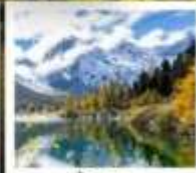
ปี้ผิงโกว