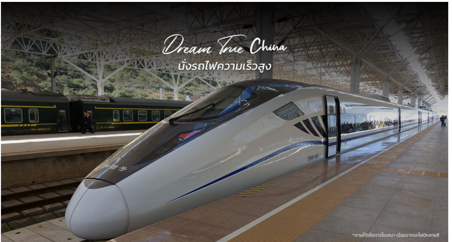
*ภาพใช้เพื่อการโฆษณา เมืองจากรถไฟหลายสี

นำท่านเดินทางสู่ สถานีรถไฟ เพื่อโดยสารรถไฟความเร็วสูง เดินทางไปยัง เมืองเจินตุ (ใช้เวลาเดินทางประมาณ 2 ชั่วโมง) ที่เพิ่งเปิดทำการไป เมื่อวันที่ 31 ส.ค. 2567 เส้นทางรถไฟนี้เป็นส่วนหนึ่งของเส้นทางรถไฟจากเจินตุ-ชหนิงในมณฑลซิงไห่ ซึ่งมีระยะทางรวม 836 กิโลเมตร ผ่านเมืองสำคัญในมณฑลเสฉวน กานซู และ ซิงไห่ โดยออกแบบให้รองรับความเร็วสูงสุดที่ 200 กิโลเมตรต่อชั่วโมง การเปิดให้บริการเส้นทางนี้จะช่วยอำนวยความสะดวกในการเดินทางของประชาชนในพื้นที่ และส่งเสริมการพัฒนาเศรษฐกิจและสังคมในภูมิภาคและสนับสนุนการพัฒนาภาคตะวันตกของประเทศในยุคใหม่