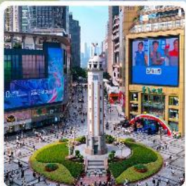
ถนนเจี๋ยฟางเป่ย์