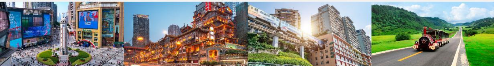
ถนนเจี๋ยฟางเป่ย์