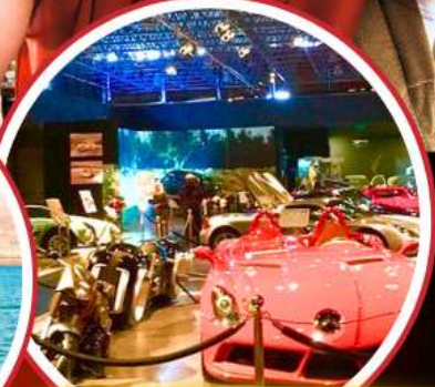
Royal Automobile Museum