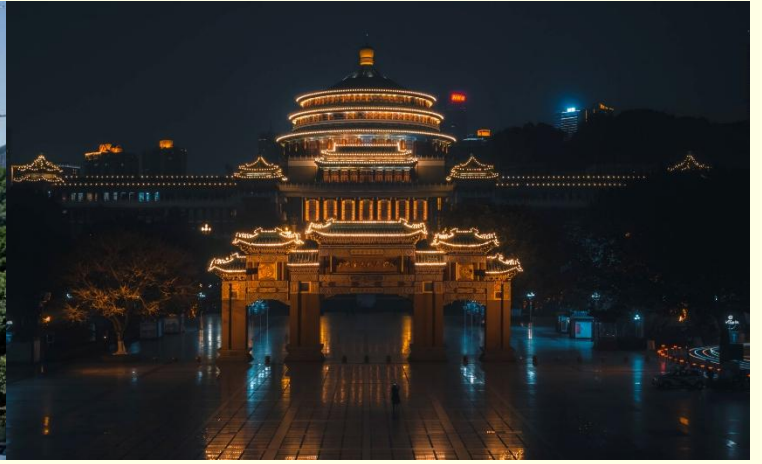
ศาลาประชาชน