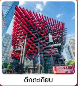
ตึกตะเกียบ