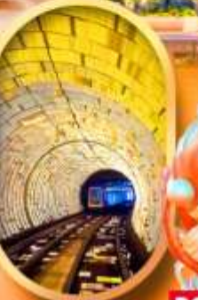
อุโมงเลเซอร์