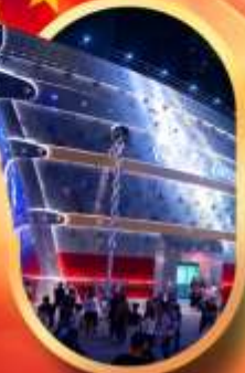
เรือเดอะหลุยส์