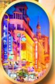
ถนนหนานกิง