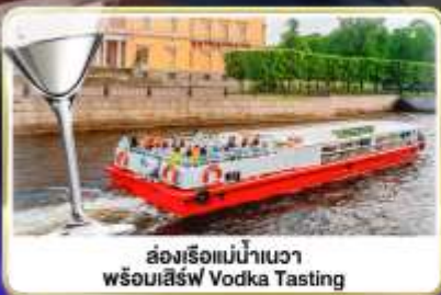
ล่องเรือแม่น้ำวอวา พร้อมลิ้ม Vodka Tasting