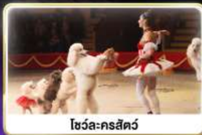
โชว์ละครสัตว์