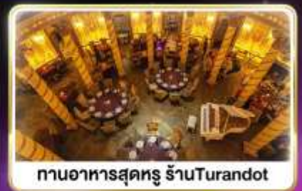
ทานอาหารสุดหรู ร้านTurandot