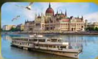
ส่องเรือแม่น้ำดานูบ พร้อมจิบแชมเปญ