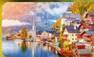
การันตีพัก Hallstatt / St. Wolfgang หรือริมทะเลสาบ 1 คืน