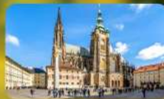
เข้าชม 2 ปราสาท ปราก และเซินบรุนน์