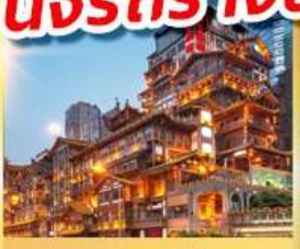
หงหยาดิ่ง