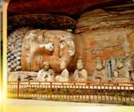
พระแกะสลักหินต้าจู้

เดินทาง 05 เม.ย. - 10 เม.ย. 69 ** วันหยุดจกักรี **