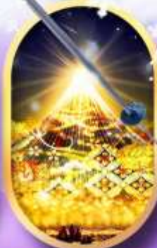
นาบานะ โนะ ซาโตะ