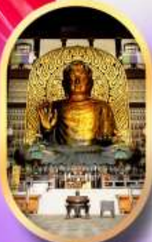
พระใหญ่เอจิเซ็น