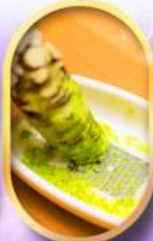
พิพิธภัณฑสถานแห่งชาติ