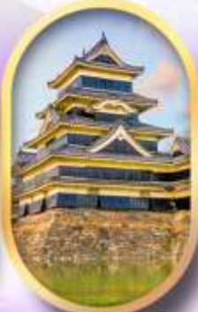
ปราสาทนัตสึโมโตะ