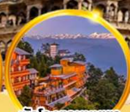
พักโรงแรมบนเขา ชมวิวหิมาลัยสุดฟิน