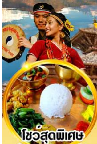
ไข่อุดพิเศษ ลิ้มรสอาหารเนปาลแท้ๆ

กาฐมัณฑุ โทครา ภัคตาปัวร์ ปาทัน นากากีฮอต