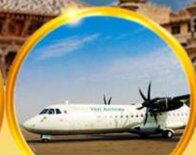
บินภายใน 1 ชม