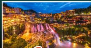
เมืองโบราณฝูหลิง