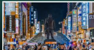
ถนนแดนเดินเซว่งซิงคู่