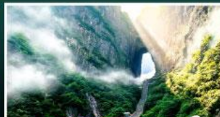
เขาประตูลี้สวรรค์