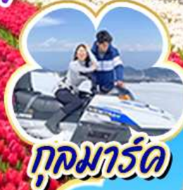
กุลมาร์ค