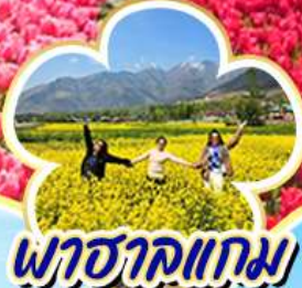
พาฮาลแกม