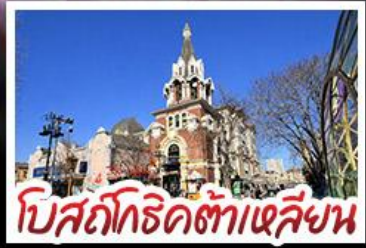
โบสถ์โกธิคต้าเหลียน