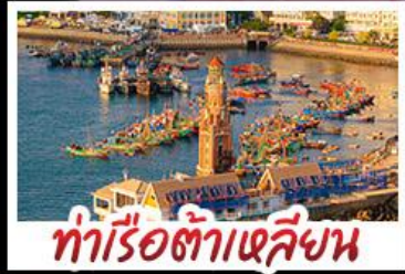
ท่าเรือต้าเหลียน