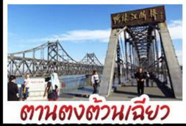
ตามองตัวเมือง