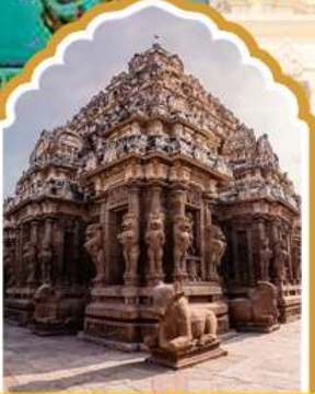
กาญจิปทุม