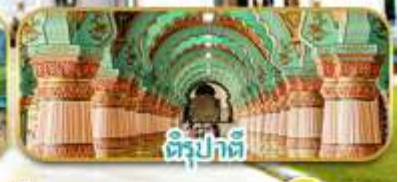
ติร์ปาทิ