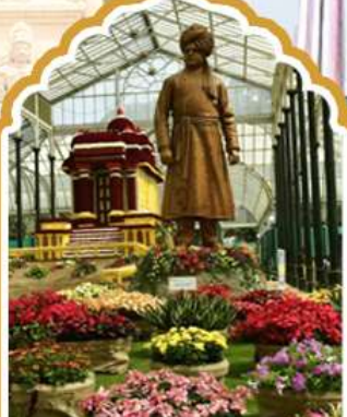
บังกาลอรั