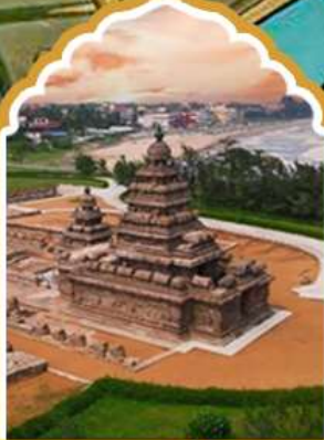
มหาวิทาลัยปทุม