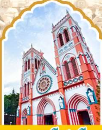
ปอนตีเซอรั